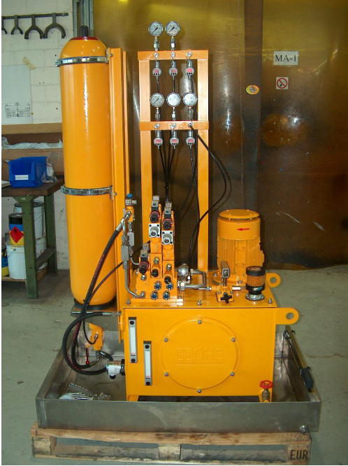
Lizerne et Morge SA